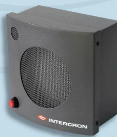
Bafle Potenciado para Exterior