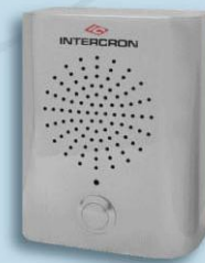
Bafle de Acero Inoxidable para intemperie